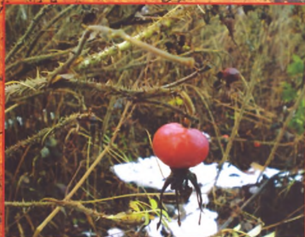
Ягоды на снегу