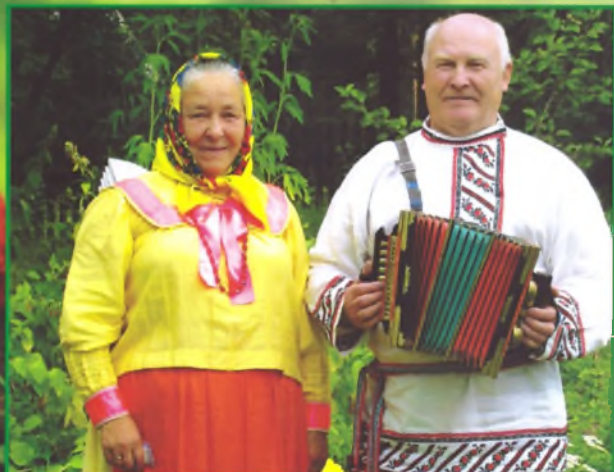
Во садочке гуляла