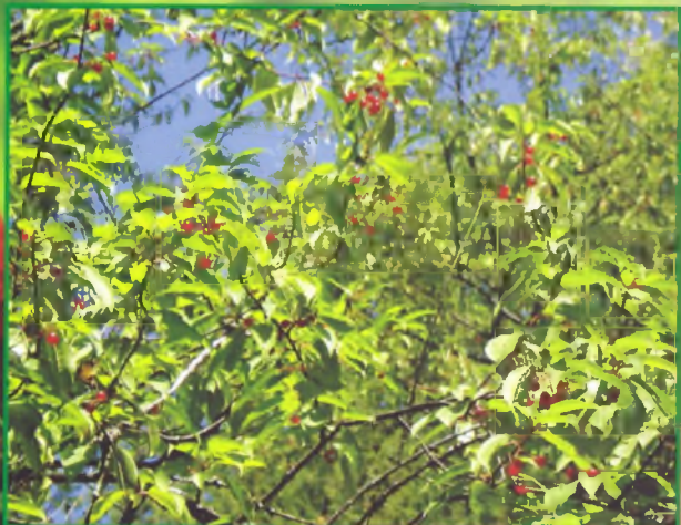
Церападус-гибрид черемухи и вишни