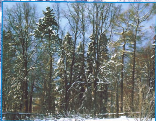
Дубы, липы, кедры - патриархи сада